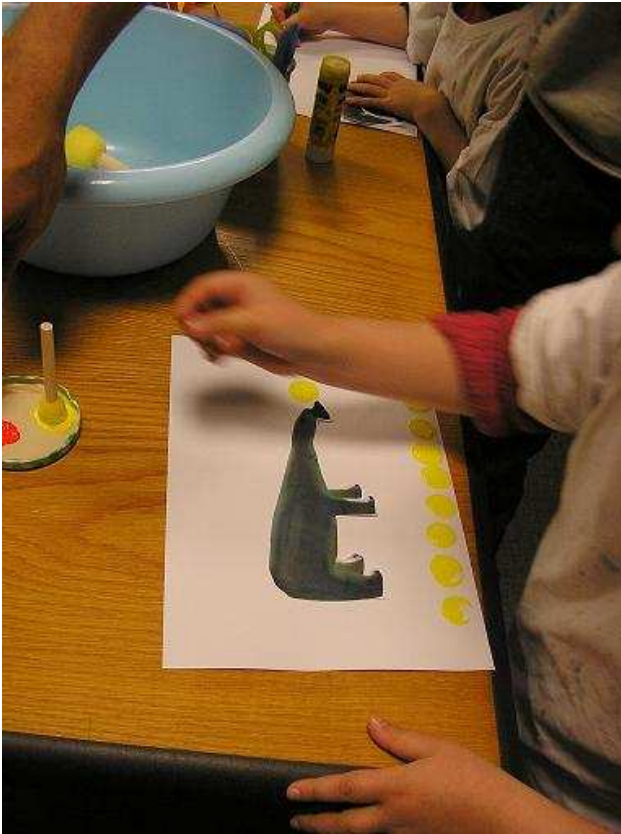
Etape 1 : choix de l'animal