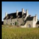
Manoir de Kernault Mellac