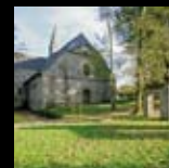
Abbaye du Relec Plounéour-Ménez